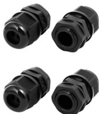
Set extra wartels