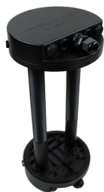
PVtube YMKV Art.nr: PVT-AC