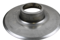
FlatRoof adapter Diameter: 500mm