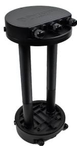
PVtube 1 string Art.nr: PVT-1S