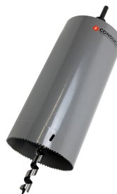
PVtube 152mm boor met 6-kant schacht Diameter: 152mm