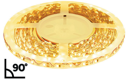
Art. no. 50055095