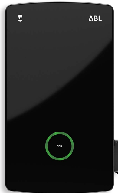
Référence du produit 100000452

Sa conception robuste et sa finition de qualité protègent la Wallbox eM4 Single des agressions extérieures. Grâce à son équipement standard avec un interrupteur différentiel de type A et contrôleur d'isolement à courant différentiel résiduel, la Wallbox est prête à brancher. Toutes les Wallbox d'ABL sont « Made in Germany » et offrent le plus haut niveau de sécurité.