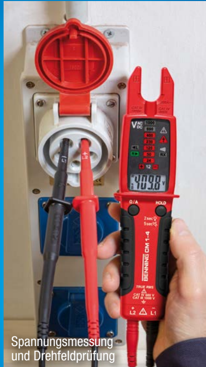
Spannungsmessung und Drehfeldprüfung